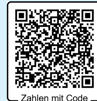
Zahlen mit Code